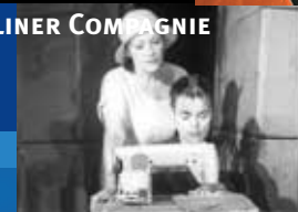
THEATER IM KONRADHAUS