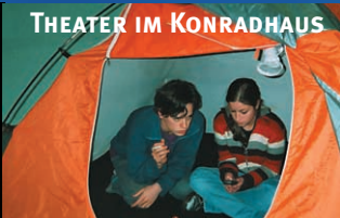
FLYING DANISH SUPERKIDS